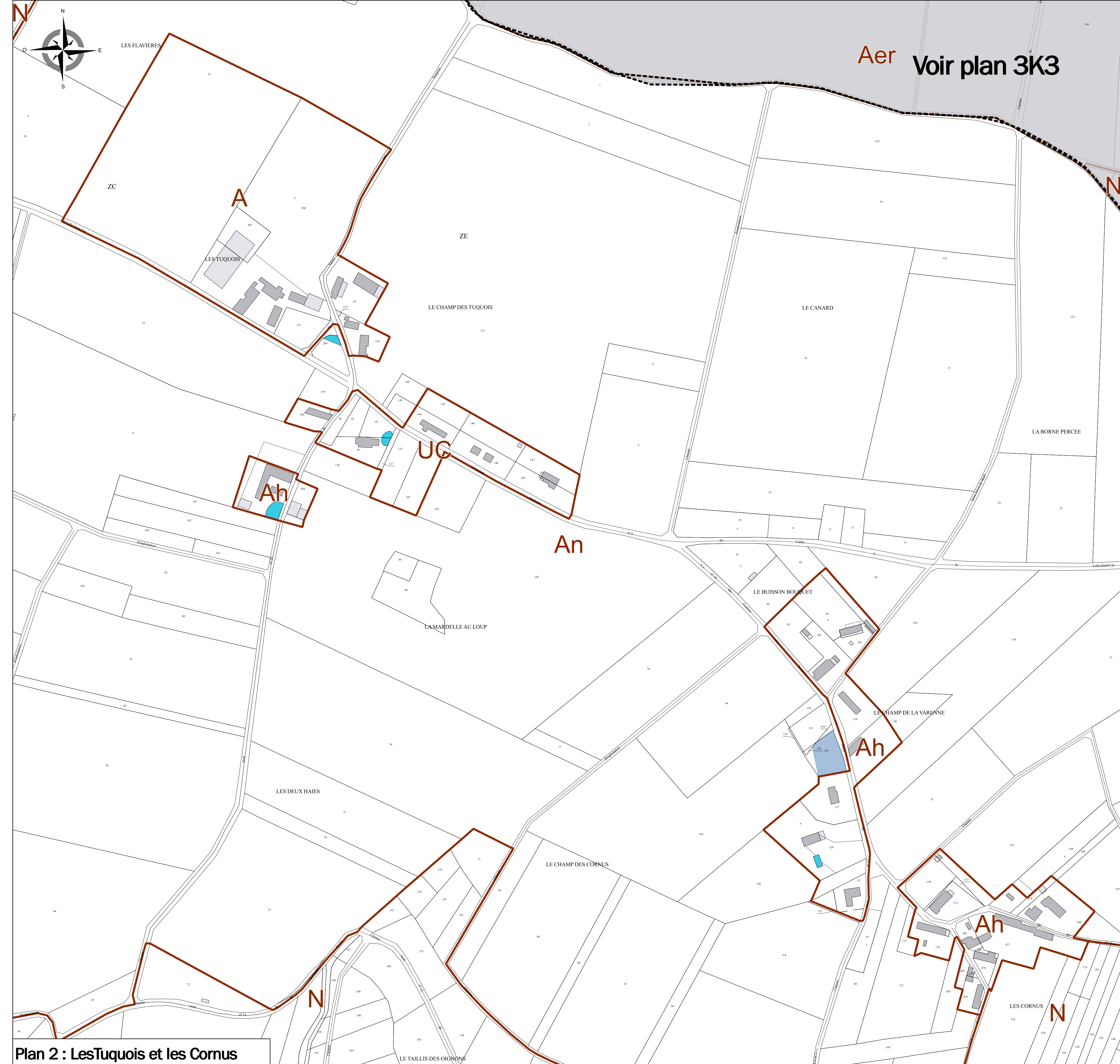
Plan 2 : Les Tuquois et les Cornus